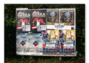
Panneau d'affichage libre