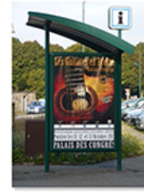
Relais Infos Services (R.I.S.)