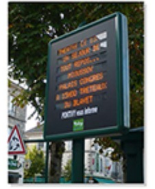
Panneau d'affichage lumineux centre ville